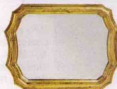
MIROIR en MDF et verre, L 36 x l 26,5 cm. « Baroco », Côté Table, 52,50 €.