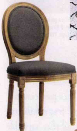
CHAISE en bois et polyester, L 51 x P 41 x H 97 cm. « Léonie », Gifi, 129 €.