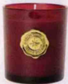
BOUGIE parfumée, en verre, Ø 7 cm, H 8 cm. H & M, 5,99 €.