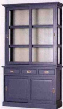
VAISSELIER en pin recyclé, 120 x 230 cm. « Esther », Tikamoon, 1 299 €.

fonctionnelle et conviviale, tous les décors sont imaginables. Par Fanny Daibera