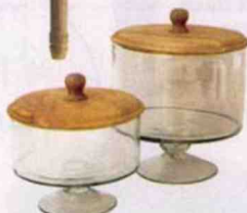
BOCAUX avec couvercle, en verre et bois, Ø 21 et 24 cm. Chehoma, 91 € les 2.

Une table en bois brut, un vaisselier vitré ou des chaises médaillon sont la base d'une ambiance classique réussie. Elle est actualisée grâce à quelques détails décoratifs bien trouvés comme ce tapis berbère épais et chaleureux, ou des succulentes qui apportent une touche de verdure. (Ambiance La Redoute Intérieurs.)