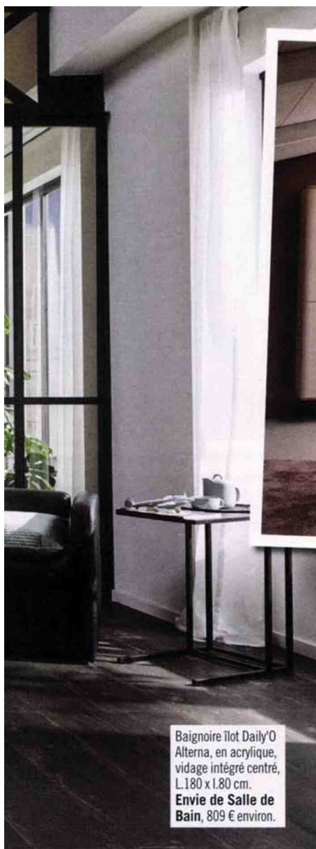
Baignoire îlot Daily'O Alterna, en acrylique, vidage intégré centré, L.180 x l.80 cm. Envie de Salle de Bain , 809 € environ.