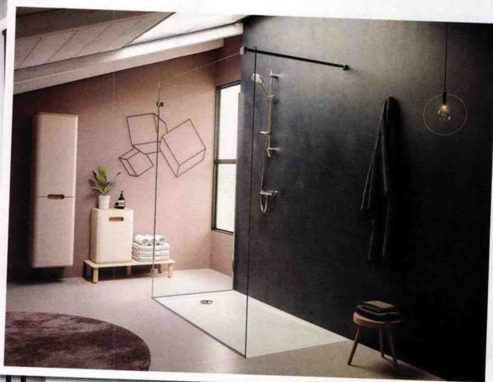
Receveur ultra plat Smooth, en acrylique sanitaire, à poser ou à encastrer, L. de 90 à 180 cm x l. de 70 à 90 cm. Vitra , à partir de 218 € environ.