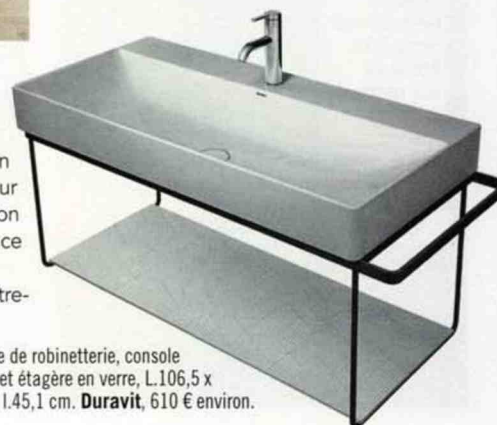
Lavabo Durasquare, en céramique avec plage de robinetterie, console métallique sur pieds noir mat avec porte-serviettes et étagère en verre, L.106,5 x l.45,1 cm. Duravit , 610 € environ.

- un carrelage aspect béton , facile d'entre-