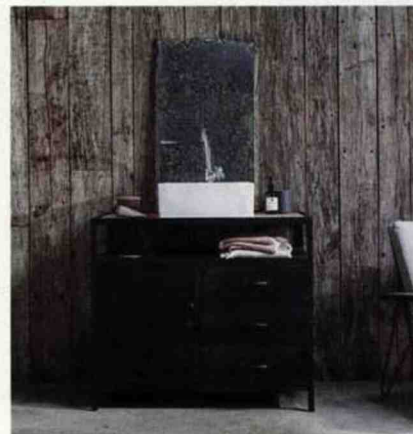
Meuble Industriel, métal et manguier, H.80 x L.95 x P.55 cm. Tikamoon , 599 € environ.