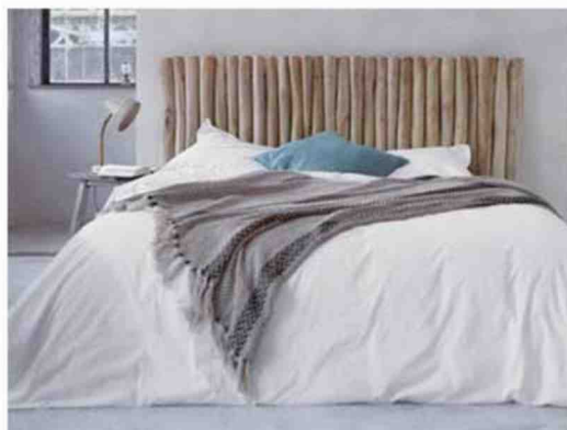
POUR ROBINSON. En rondins de teck flotté brut, elle apporte un air iodé de vacances. Pour la protéger, il est vivement conseillé de lui appliquer un vernis bois incolore, H110xL180xP9 cm, 299 €, « River », Tikamoon.